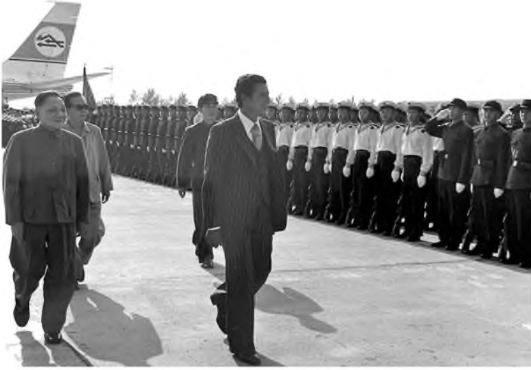
جانب من استقبال دنغ شياو بينغ لعبد السلام جلود أثناء زيارته للصين، 1976.